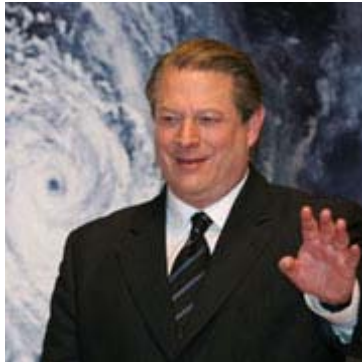
Al Gore - Opfer einer historisch gescheiterten Ideologie?

Bereits heute sichtbare Auswirkungen der Klimaänderung werden sich in verstärktem Maße in Mitteleuropa und anderswo zeigen. Ein Erfolg in der Vermeidungspolitik - im Sinne einer Begrenzung, aber nicht einer Verhinderung von menschengemachten Klimaänderungen - wird sich erst später in diesem Jahrhundert einstellen. Diese Begrenzung wird dringend nötig sein, aber sie hilft uns kaum dabei, mit den akuten Klimarisiken umzugehen.