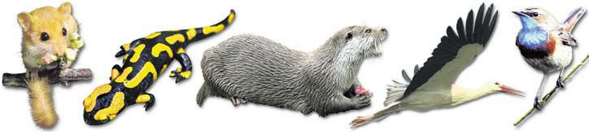
IN GEFAHR: Haselmaus, Feuersalamander, Fischotter, Weißstorch und das Blaukehlchen (von links nach rechts) zählen in Thüringen zu den fünf bekanntesten bedrohten Tierarten.